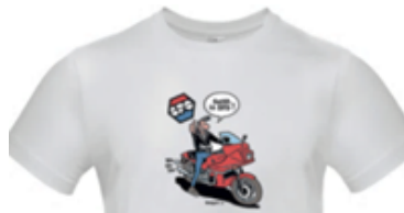
Tshirt BLANC Série Margerin

Tailles S/M/L/XL/3XL/3XL Ref. T SMA40 B Prix : 19 €