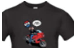
Tshirt NOIR Série Margerin

Tailles S/M/L/XL/3XL/3XL Ref. T SMA40 B Prix : 19 €