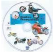
Vadimof le DVD