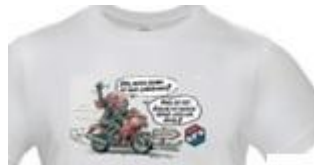
Tshirt DESSIN Marc Bertrand (version « nous on est écolos ») BLANC Ref. TSBE40B Taille M