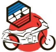
Sweat Shirt Club BFG

Logo avec Moto Gris impression 3 couleurs Tailles S, L