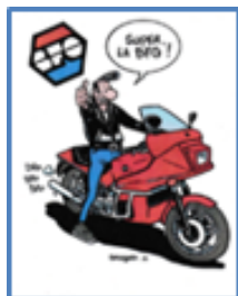
Autocollant Série Margerin