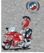
T Shirt « Ulysse+logo BFG »

chiné/ encolure ronde impression couleurs Taille S, XXL