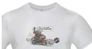
Tshirt DESSIN Marc Bertrand (version originale) BLANC Ref. TSBOR40B Tailles S/M/L/2XL/3XL

Lot de deux cartes Ref. CPMA Prix : 1,00 € (le lot de 2)